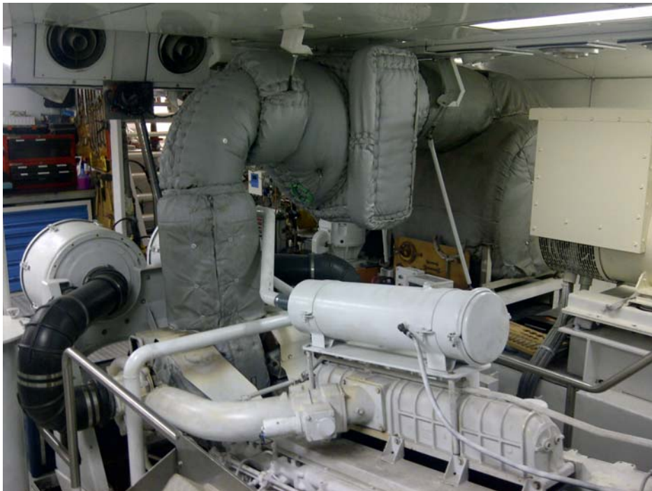
Purificador oxocatalítico de unos de los motores propulsores

Para este proyecto, DSF Tecnologías ha confiado en su representada DCL International Inc. el diseño y fabricación de 2 purificadores oxocatalíticos que permita la reducción de emisiones de los 2 motores propulsores del M/Y Shubra II.