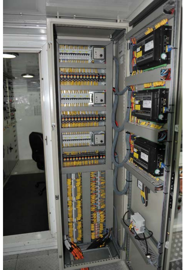
Interior del cuadro de control del nuevo sistema de control

DSF Tecnologías ha controlado todas las fases del proceso: Ingeniería, desarrollo, fabricación, instalación y puesta en marcha. La comunicación con el cliente ha sido continua y fluida, con lo que el cliente ha podido personalizar la solución partiendo de la base de un sistema de control avanzado basado en tecnología punta.