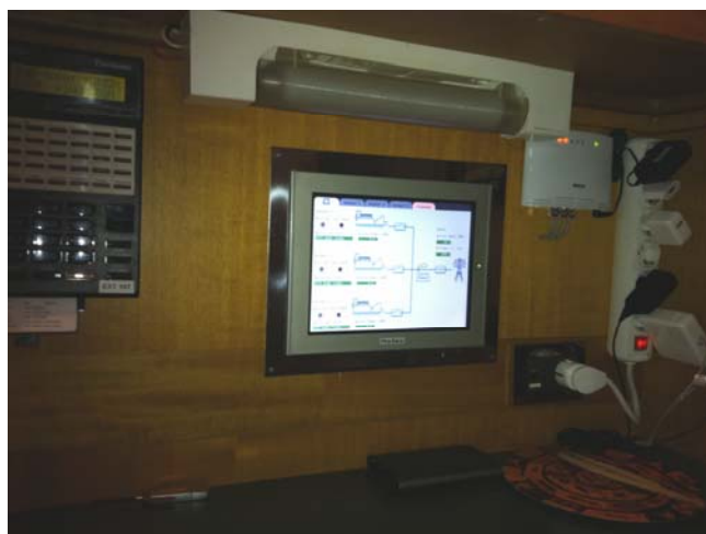
Vista del sistema SCADA instalado en el camarote del jefe de máquinas

DSF Tecnologías ha controlado todas las fases del proceso: Ingeniería, desarrollo, fabricación, instalación y puesta en marcha. La comunicación con el cliente ha sido continua y fluida, con lo que el cliente ha podido personalizar la solución partiendo de la base de un sistema de control avanzado basado en tecnología punta.