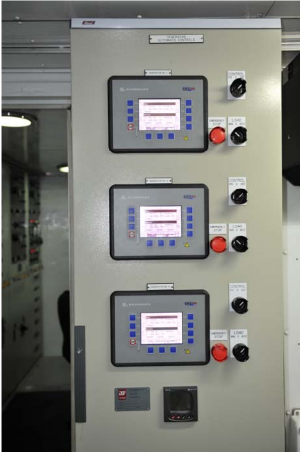
Exterior del cuadro de control del nuevo sistema de control