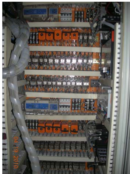
Interior del cuadro de control de uno de los grupos y de la toma de puerto existentes

El PMS original, repartido en 2 cuadros de control, posee un modo de funcionamiento semi-automático para los auxiliares, mediante sincronizadores y repartidores de carga analógicos, y totalmente manual para la toma de puerto, mediante potenciómetros y sincronoscopios. Esto implica la intervención obligatoria del ingeniero-jefe para las operaciones de acoplamiento en paralelo de los auxiliares y para la sincronización con la toma de puerto.