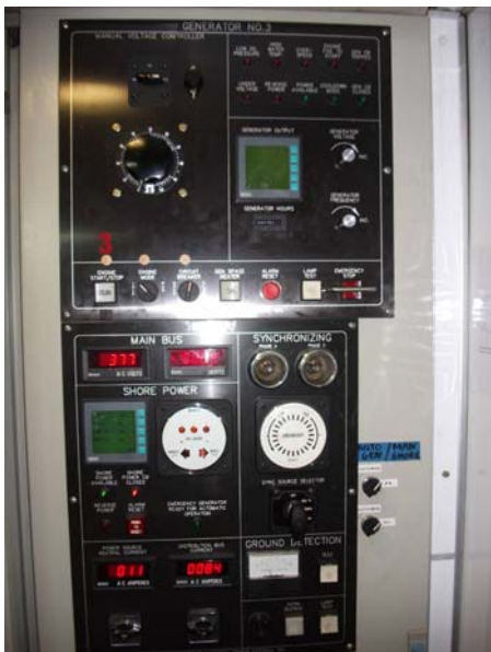
Exterior del cuadro de control de uno de los grupos y de la toma de puerto existentes

Cada generador está provisto de un pequeño cuadro de control donde se muestra la velocidad, presión de aceite y temperatura de agua.