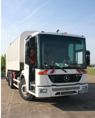
Econic hulladékgyűjtő jármű Budapesten