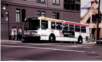
NABI busz San Francisco-ban